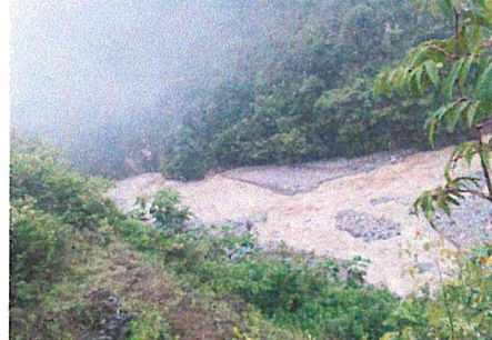
FOTO 02: Vista de afectación a las áreas de cultivo de la población de Mayapo.