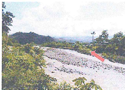
FOTO 01: Vista de las viviendas afectadas por desborde del río Mayapo