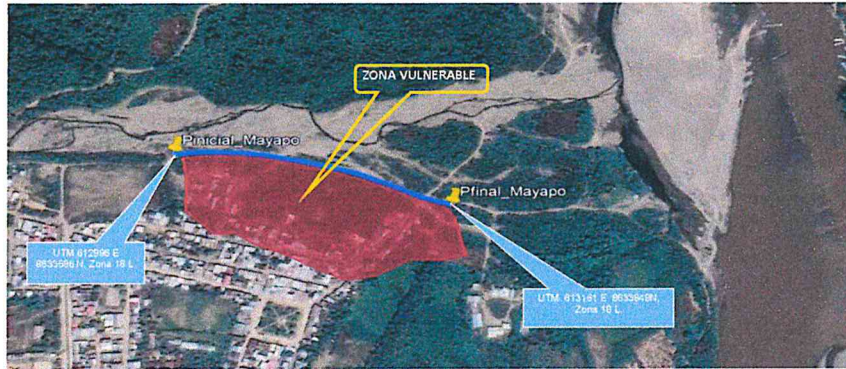
VIII- PANEL FOTOGRÁFICO DE ZONA VULNERABLE